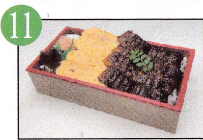
うなぎ出汁巻き重 2,268円